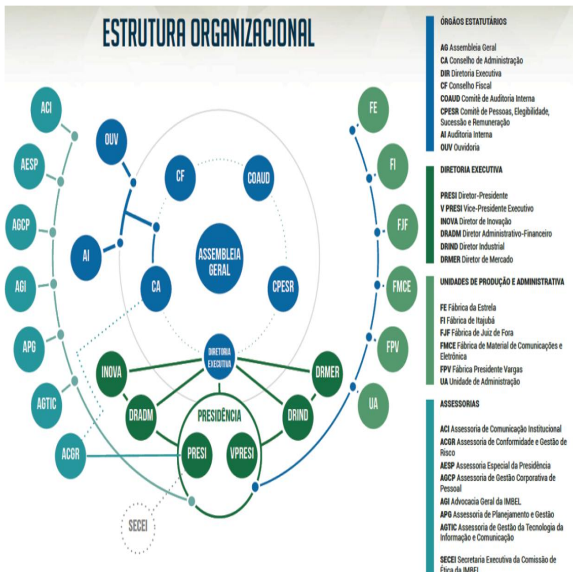
Figura 1: Organograma da IMBEL ®

3.1.1.3 Sua visão de futuro é ser reconhecida no mercado nacional e internacional como uma empresa de excelência no desenvolvimento, fabricação e fornecimento de soluções de defesa e segurança.