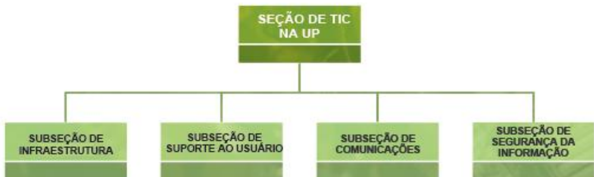
Figura 3: Organograma da Seção de Tecnologia da Informação e Comunicação das UP (SETIC)